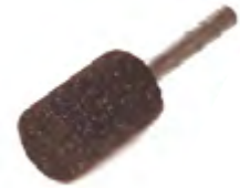
NERO | INOX

Le mole su perno GLOBE sono indicate per operazioni di smerigliatura o finitura. Le specifiche si distinguono in base al colore: