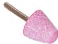
ROSA | ACCIAIO