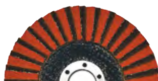
ULTRA COARSE (CERAMICO)

FINISHING PRO nasce dall'idea di creare un disco lamellare di nuova generazione abbinando normali lamelle di tela abrasiva a lamelle in tessuto non tessuto tipiche dei dischi per finitura. Le lamelle in tela abrasiva sono deputate allo "sgrosso", mentre quelle in tessuto non tessuto, grazie alla fine granulometria, lucidano il metallo conferendogli un basso livello di rugosità superficiale ed un aspetto lucente. La versione con tela ceramica ha una velocità di asportazione almeno doppia rispetto a quella dei dischi lamellari al corindone e il 50% in più di durata. FINISHING PRO ceramico è indicato per veloci operazioni di sgrossatura e precedere, ove necessario, le varie lavorazioni di finitura ottenibili con le versioni di FINISHING PRO a grana ULTRA COARSE, COARSE, MEDIUM o FINE.